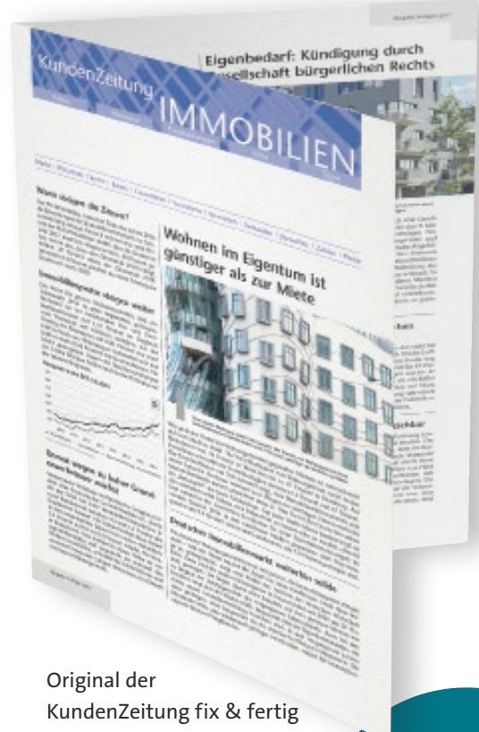
Original der KundenZeitung fix & fertig

500 KundenZeitungen mit eigenem Kopf 470 Euro