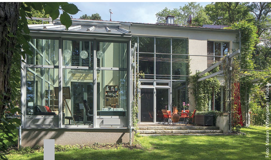
Ein Raum unter Glas bietet in der kühleren Jahreszeit jede Menge Spielraum.

Ein Wintergarten ist ein Gewinn an Lebensqualität – aber längst kein Luxus mehr. Er bietet mehr Lebensraum und ist ein Beitrag zum Energiesparen. Nach Norden ausgerichtet bietet er ganztags mildes Licht, nach Osten lässt er die Morgensonne auf den Frühstückstisch scheinen, im Westen verlängert er sonnige Abendstunden. Die meisten Eigentümer wählen jedoch – wenn irgend möglich – die Südseite. Dort wirkt der Wintergarten als Wärmepuffer im Sommer und als zusätzliche Isolierung gegen Kälte im Winter. In Wohnwintergärten kann eine elektronische Klimasteuerung für Wohlfühlklima sorgen. Die Anlage regelt die Luftfeuchtigkeit und die Temperatur, steuert die Heizung und die Lüftung. Moderne Mehrfachverglasung minimiert den Energieverlust. Zusätzlich gibt es Glas, das vor Lärm oder UV-Strahlen schützt, das sich selbst reinigt oder bruchfest ist. Ganzjährig bewohnbare Wintergärten sind ab etwa 15.000 Euro zu haben, individuelle Konstruktionen können ein Vielfaches kosten.